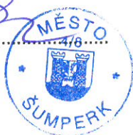
..... Zdeněk Hojgr